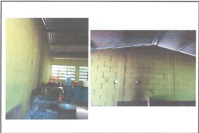
Reparación o sustitición de área de cocina (estufas rurales, pilas, ventanas, puertas, chimeneas, etc)