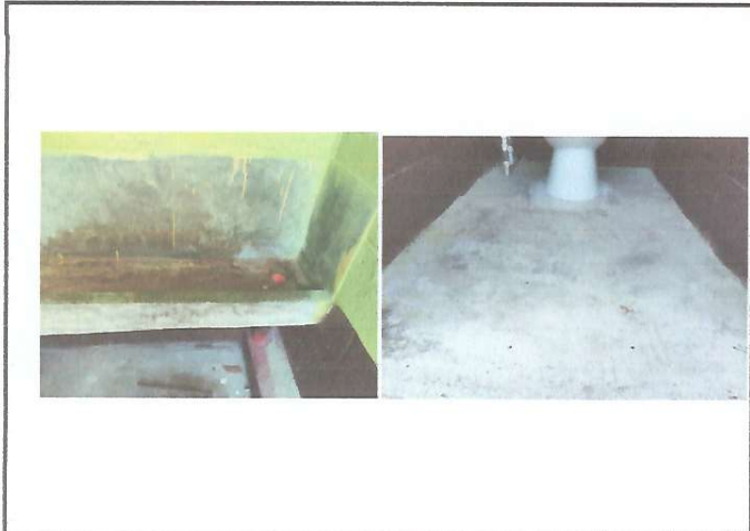
Reparacion y sustitucion de azulejos en baños