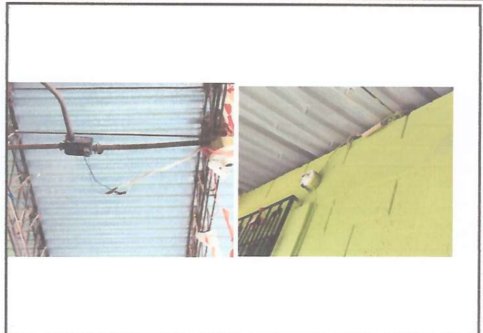
Reparación del sistema electrico